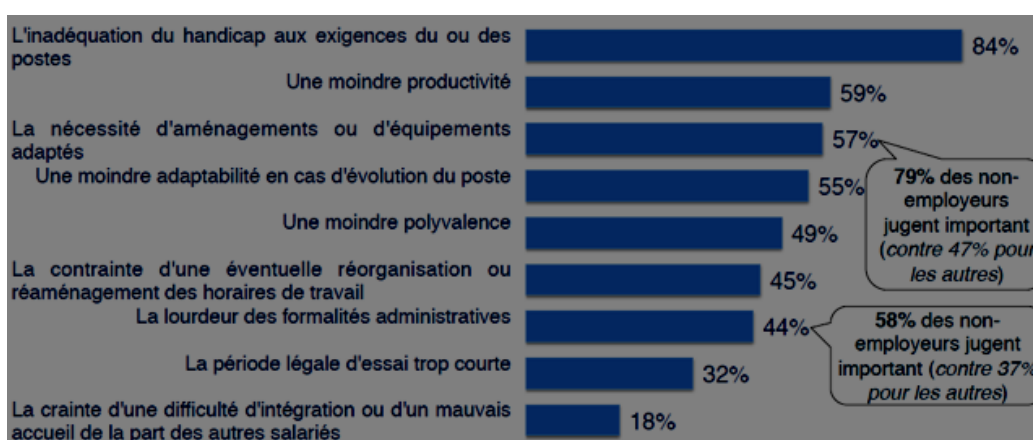
Figure 2 : Statistiques des réponses sur le frein à l'égard de l'embauche de personnes handicapées (IPSOS, 2014, op. cit.)

Malgré une bonne mobilisation et une campagne de sensibilisation auprès des entreprises réalisée par l'AGEFIPH sur l'image positive des personnes handicapées en entreprise, les préjugés restent encore nombreux. Cela est donc insuffisant.