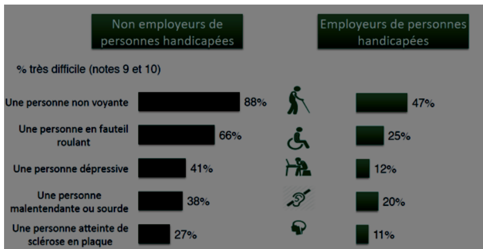
Figure 3 : Question aux entreprises : Au moyen d'une échelle de 1 à 10, pouvez-vous qualifier le niveau de facilité ou de difficulté que vous ressentez si vous deviez intégrer des personnes atteintes de différents handicaps ? (IPSOS, 2014, op. cit.)

Ce résultat n'est pas surprenant car contrairement aux autres travailleurs handicapés, cet accompagnement doit aborder aussi des questions de différences culturelles entre les sourds (semblables à une minorité) et les entendants. Ces études ont démontré qu'il est indispensable d'accompagner au moyen d'expertises spécifiques puisqu'il est question de différences culturelles et sociales.