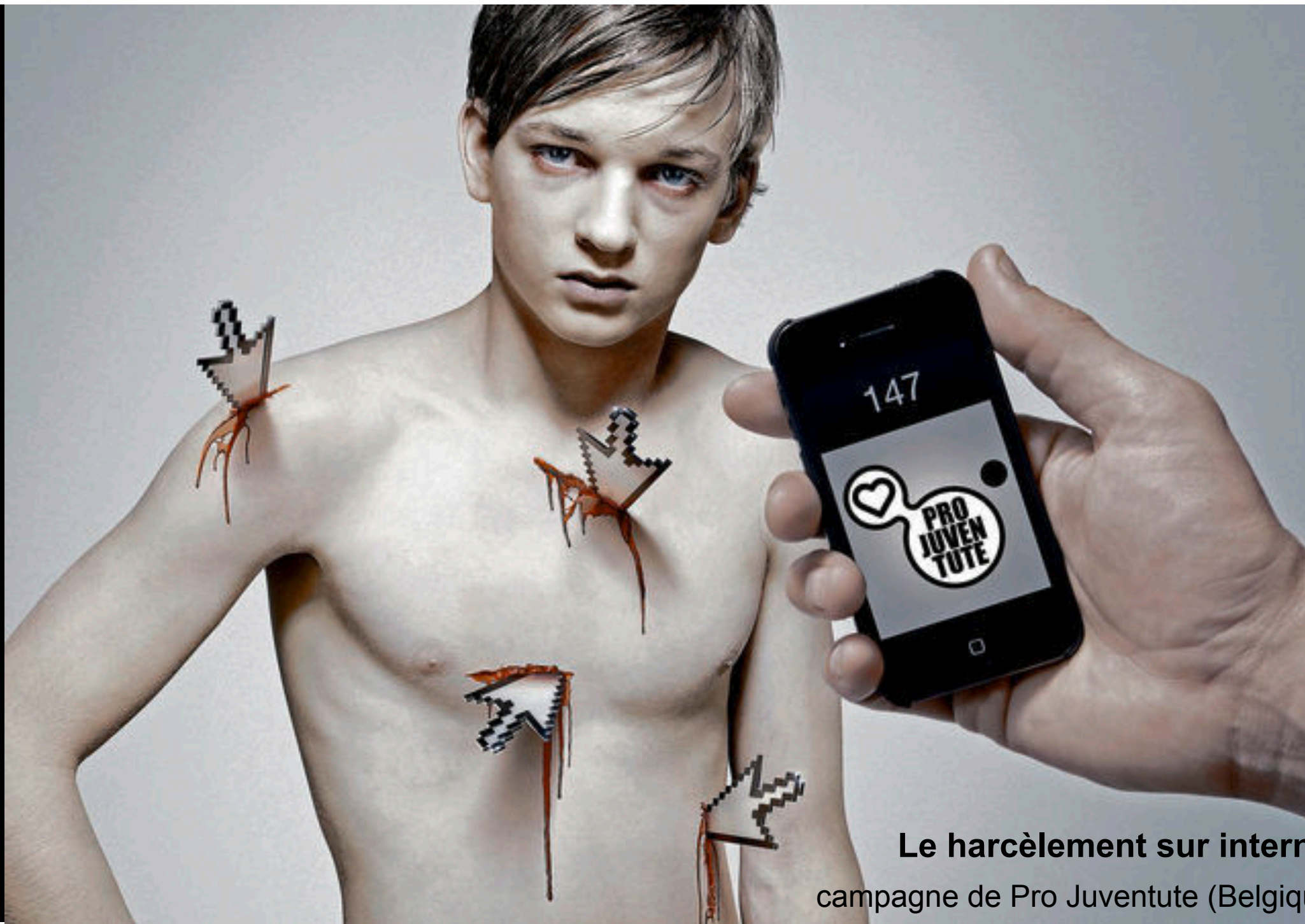
Le harcèlement sur internet campagne de Pro Juventute (Belgique)